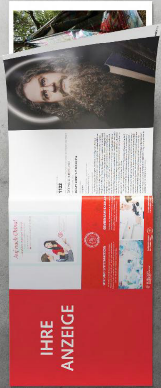
OSTRALE-Begleitheft 2016* – Anzeige *Format und Ausführung kann jährlich wechseln