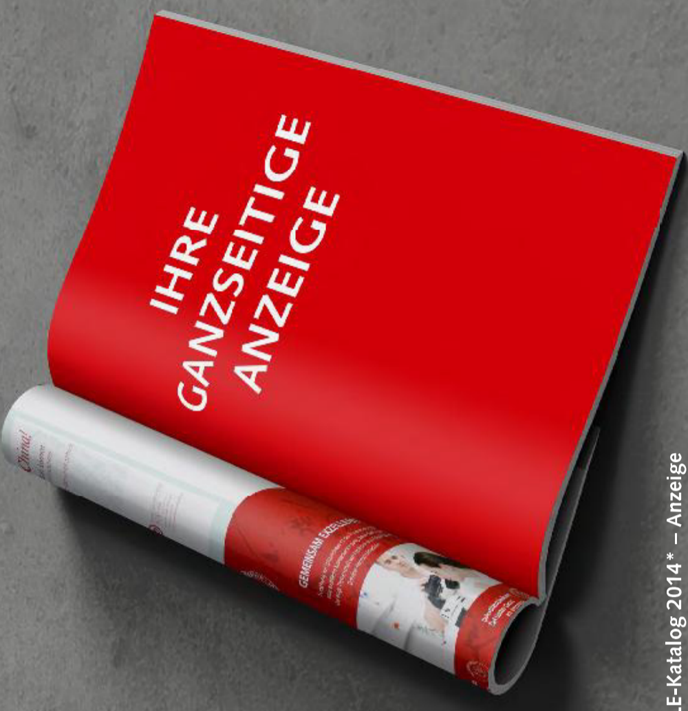
OSTRALE-Katalog 2014* – Anzeige *Format und Ausführung kann jährlich wechseln