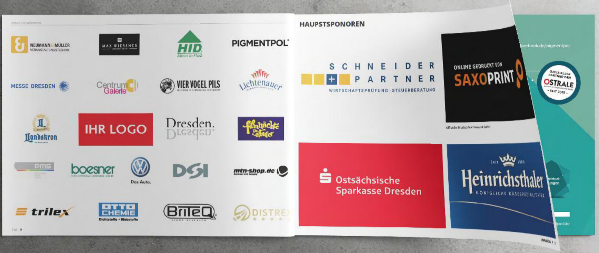
OSTRALE-Katalog 2016* – Logoplatzierung

*Format und Ausführung kann jährlich wechseln