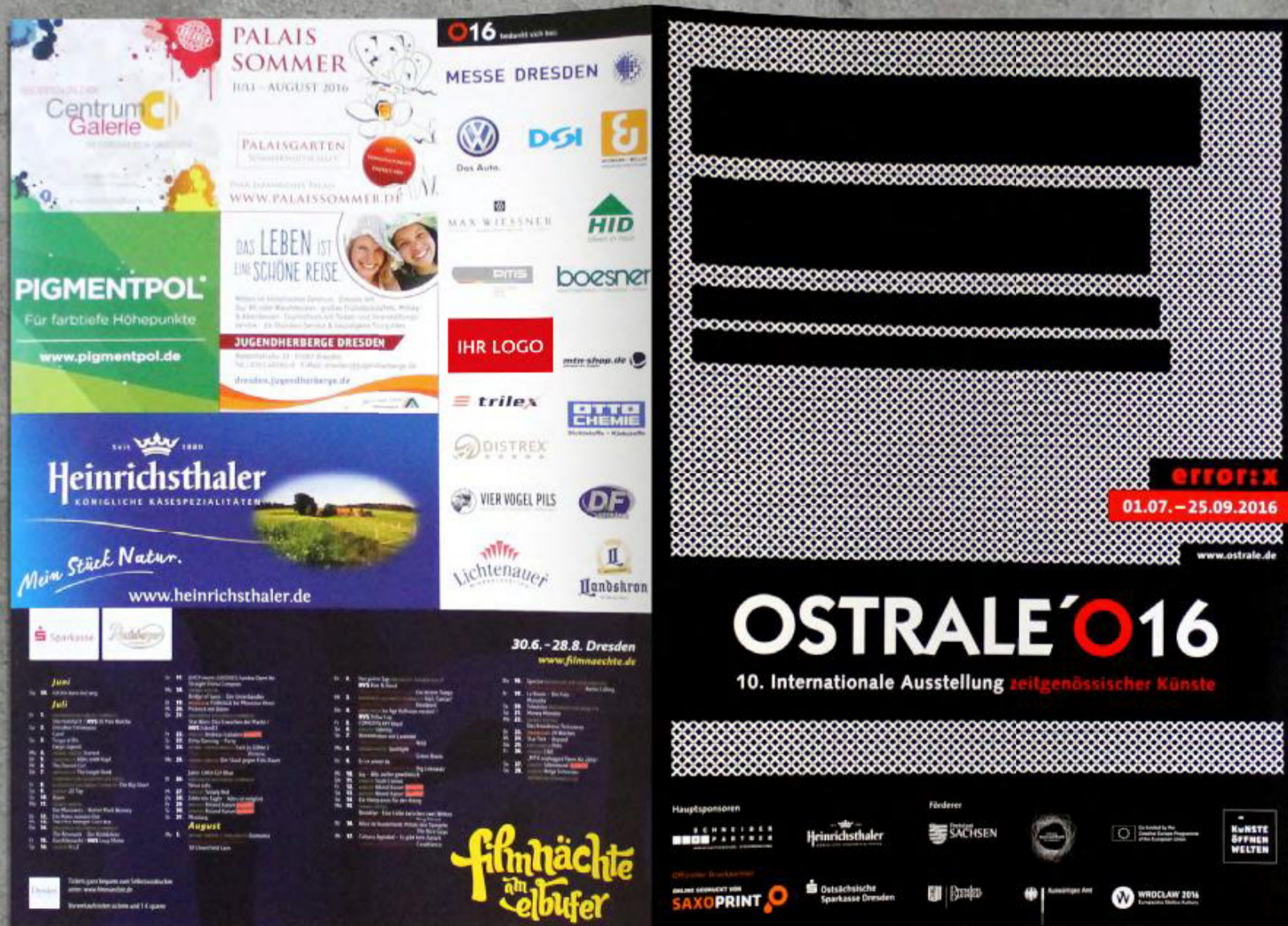
OSTRALE-Begleitheft 2016* – Logoplatzierung

*Format und Ausführung kann jährlich wechseln